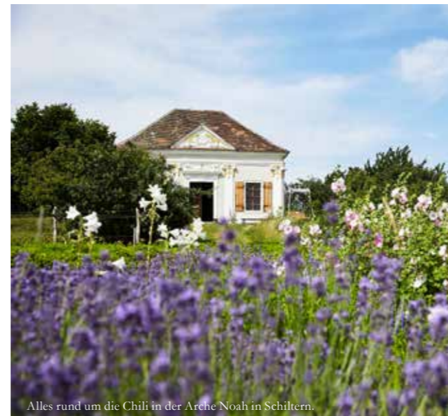
Alles rund um die Chili in der Arche Noah in Schiltern.

ARCHE NOAH Schaugarten, Obere Straße 40, 3553 Schiltern Keine Anmeldung erforderlich. www.arche-noah.at