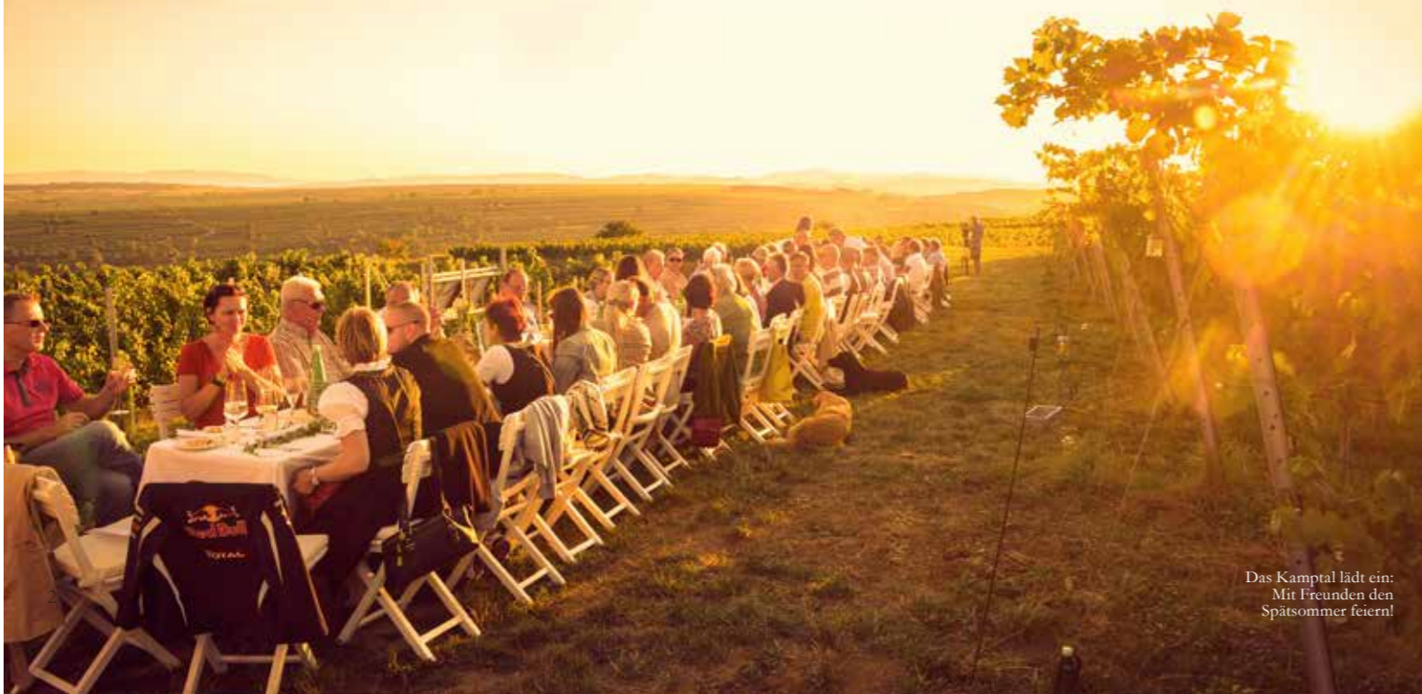
Das Kamptal lädt ein: Mit Freunden den Spätsommer feiern!