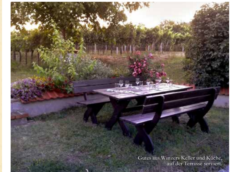
Gutes aus Winzers Keller und Küche, auf der Terrasse serviert.