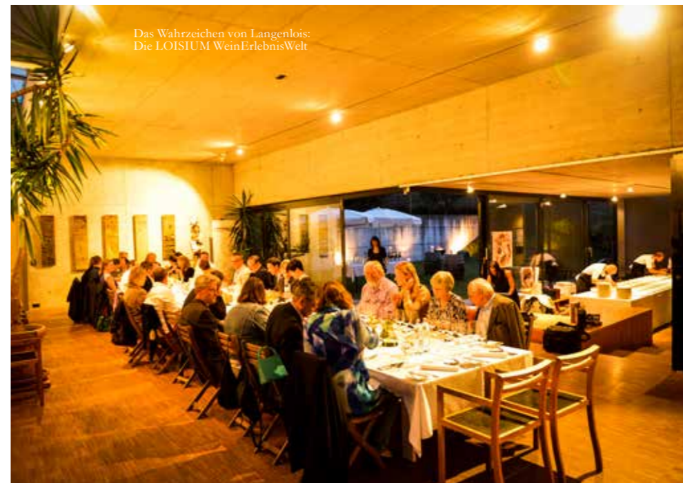
Das Wahrzeichen von Langenlois: Die LOISIUM WeinErlebnisWelt