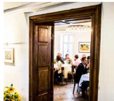
Ehrliche Speisen und Weine im 10er-Haus

LOISIUM im 10er Haus, Walterstraße 10, 3550 Langenlois Reservierung: +43 2734 322 4020, +43 664/603 27 501 oder popup@loisium.com , www.jurtschitsch.com , www.ma-arndorfer.at