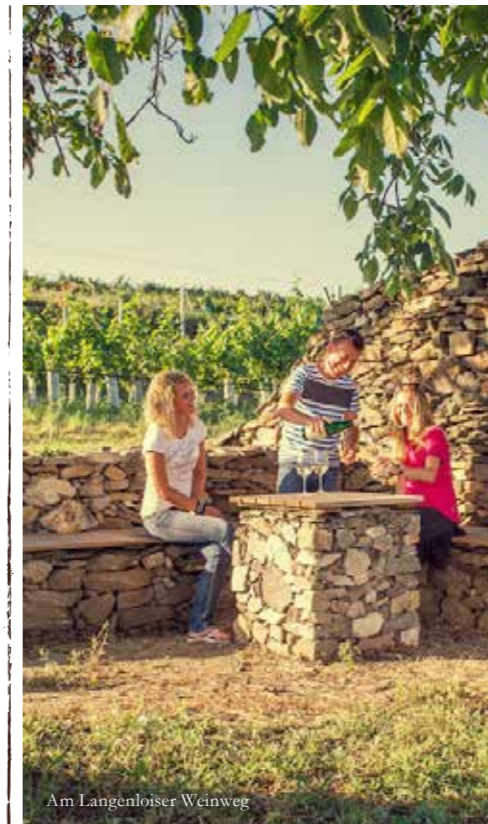
Am Langenloiser Weinweg