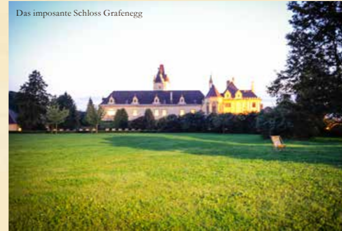
Das imposante Schloss Grafenegg

Die 33 Winzer der Österreichischen Traditionsweingüter legen großen Wert auf handwerklich gefertigte Weine, die ihre Herkunft widerspiegeln. Anfang September präsentieren die Mitglieder die Weine der ERSTEN LAGEN – die besten Tropfen von herausragenden Weinbergslagen im Donauraum. Ebenso exquisit wie die rund 130 Weine ist der Rahmen der Präsentation: Verkostet wird vor einem Konzert des Grafenegg Festival, das im prachtvollen Ambiente von Schloss Grafenegg stattfindet.