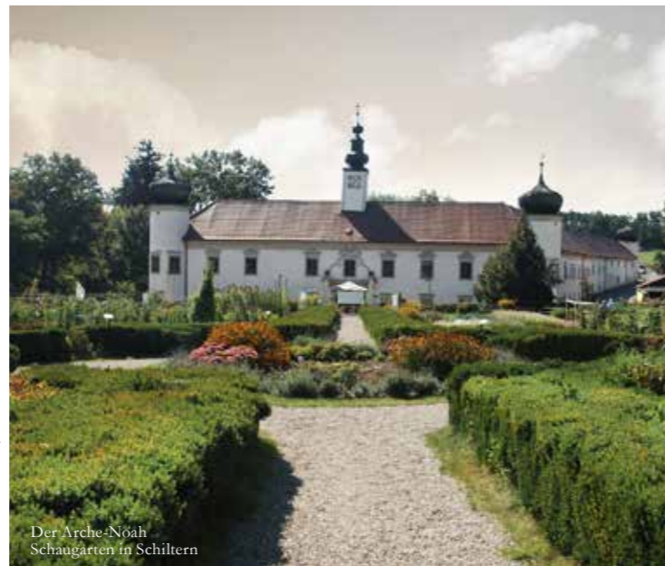
Der Arche-Noah Schaugarten in Schiltern