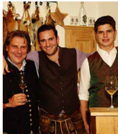
Gute Stimmung im Hause Topf