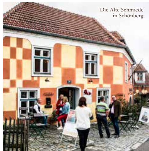
Die Alte Schmiede in Schönberg