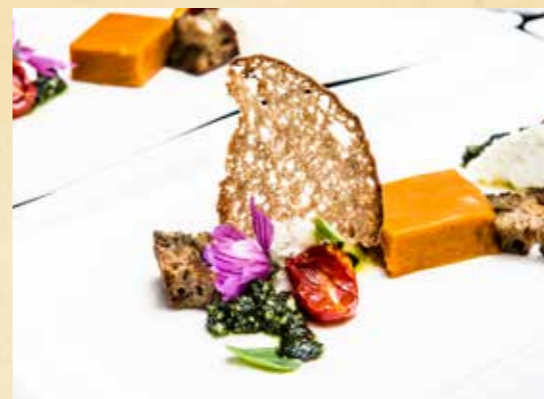
Feine Kreationen aus regionalen Spezialitäten.

Ein geflügeltes Wort besagt, dass dort, wo feiner Wein erzeugt wird, auch gerne gut und abwechslungsreich gegessen wird. Wie recht der Spruch hat, zeigen die verschiedenen kulinarischen Veranstaltungen im Kamptal, die bei Winzern , in Gasthäusern , Heurigen und Restaurants stattfinden – teilweise sogar im Freien, wenn es das Wetter erlaubt. Die Palette reicht von bodenständig bis elaboriert: Heimische Spitzenküche, nordic cuisine, ausgedehnte Brunchs, Köstlichkeiten rund um herbstliches Wild, Deftiges vom Spanferkel oder klassische Heurigengerichte, für jeden Geschmack ist etwas dabei .