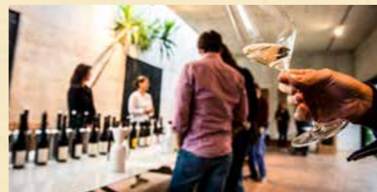
Schauen, schnuppern, schmecken: Die Winzer bitten zur Verkostung.