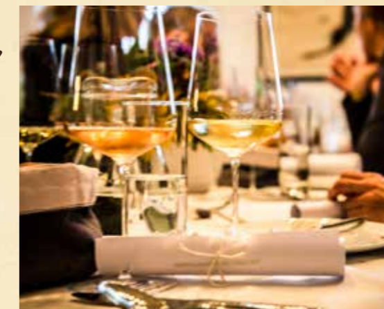
Weinkultur auf höchstem Niveau.

Wild und sanft, hügelig und flach, ländlich und weltgewandt: Das Aufeinandertreffen von Gegensätzen macht das Kamptal aus. Voller Kontraste sind hier auch die für den Weinbau wichtigen Böden – Granit, Löss und Lehm – und vor allem das Klima. Das trocken-heiße pannonische Klima, das durch das Donautal vom Osten einfließen kann, mischt sich mit den kühlen Lüften des nordwestlichen Waldviertels. Das rund 4.000 ha große Weinbaugebiet ist nicht nur eines der abwechslungsreichsten Weinreviere Österreichs , sondern mit seiner hohen Dichte an international bekannten Spitzenbetrieben auch eines der erfolgreichsten. Die Leitsorten sind die feingliedrigen und langlebigen Rieslinge und Grünen Veltliner, bemerkenswert sind aber auch die Rotweine wie der Zweigelt und der anspruchsvolle Pinot Noir.