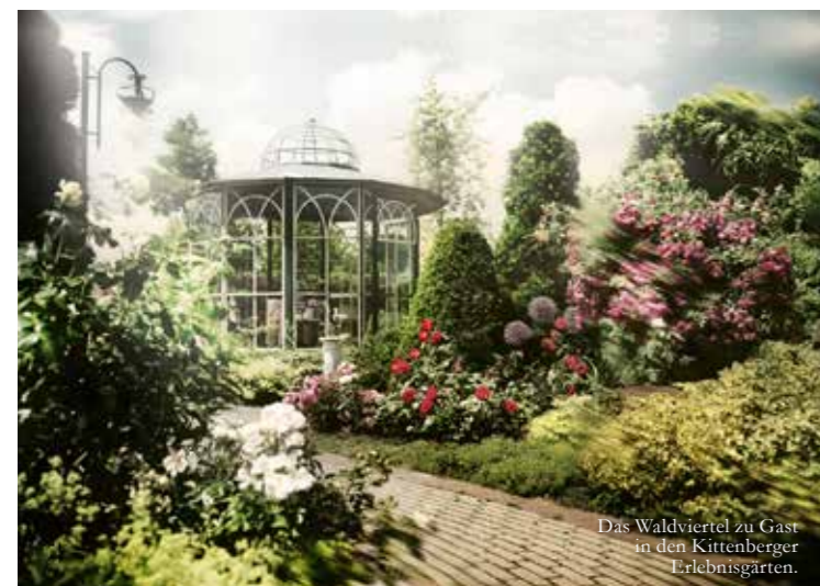
Das Waldviertel zu Gast in den Kittenberger Erlebnisgärten.

Eintritt in die Erlebnisgärten € 9,90, Kinder 4-14 Jahre € 6,- Kittenberger Erlebnisgärten, Laabergstraße 15, 3553 Schiltern Tel. +43 2734 8228, www.kittenberger.at