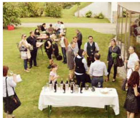
Linzer Besuch in Kammern

Weingut Hirsch, Hauptstraße 76, 3493 Kammern Reservierung Tel. +43 2735 2460 oder info@weingut-hirsch.at www.weingut-hirsch.at