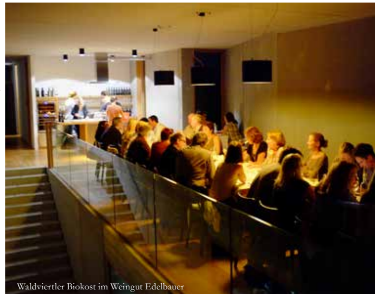
Waldviertler Biokost im Weingut Edelbauer