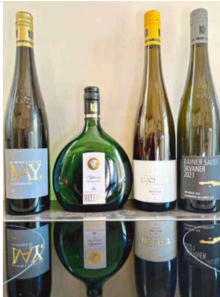
Spieglein, Spieglein auf dem Herd, wer sind die schönsten Silvaner im Land? Ein Spitzen-Quartett!

2021 Rödelseer Hoheleite Silvaner GG, Paul Weltner: Kühler, steinig-mineralischer Duft mit einem Touch mehr Frucht von weißem Steinobst, dahinter extrem würzig-mineralische Noten. Im Mund etwas feiner gewoben als sonst: zupackend, kompakt, fest und mit steiniger Tiefe, aber mit der jahrgangstypischen Kühle und