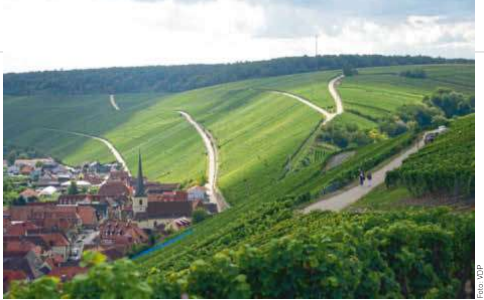
Eine von Frankens Paradelagen: Der Escherndorfer Am Lumpen 1655

2020 Iphöfer Julius-Echter-Berg Silvaner GG, Juliusspital Würzburg: Auch hier macht sich die längere Reife positiv bemerkbar. Ruhiges, ausgewogenes Bouquet mit feiner Holzumrahmung vom großen Holzfass, wenig Frucht, dafür viel dunkle Würze. Eleganter, dicht gewobener Gaumen, dabei saftig und mit würziger Linie, sehr feine Aromatik, nicht überbordend kraftvoll, zeigt sich stimmig mit eher kühlen Anlagen. Aus einem Guss. Well done! 17.5/20 2023 – 2031