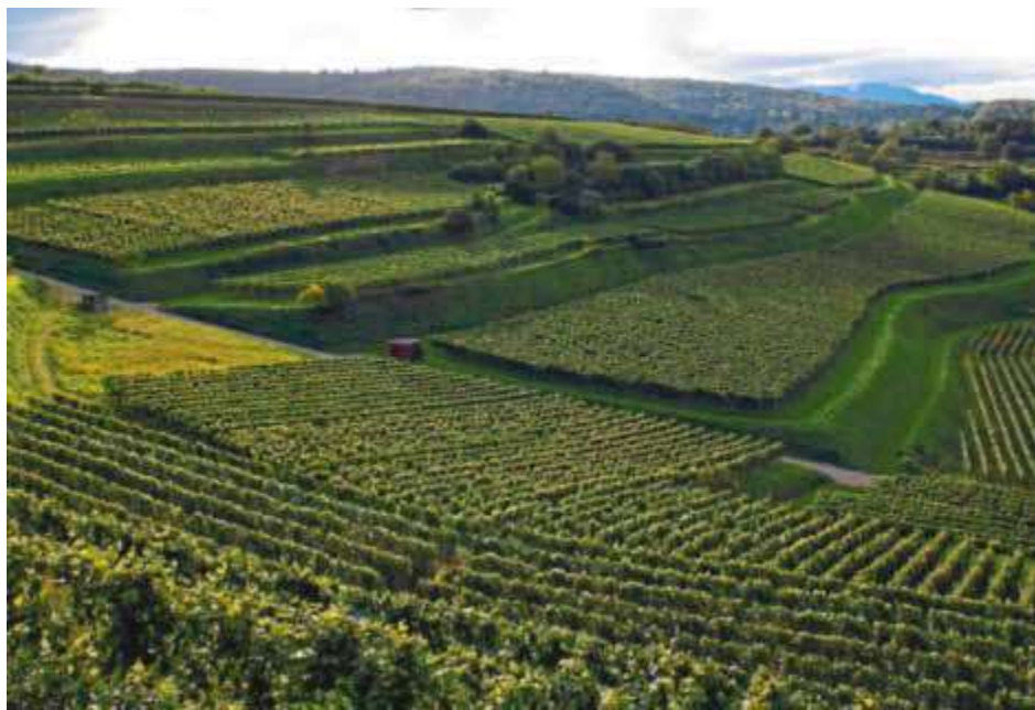
Im badischen Malterdingen wachsen große weiße und rote Burgunder wie hier im Bienenberg vom Weingut Huber